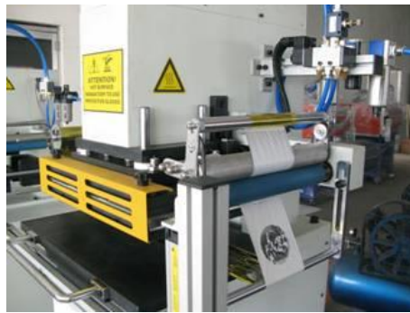
One group foils running