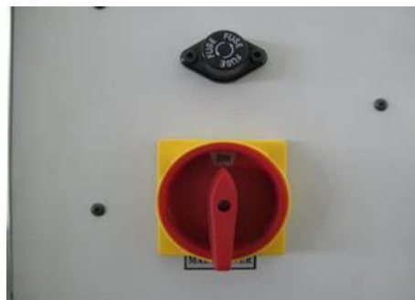
Power switch as CE standard