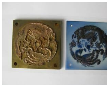
Male & female die for stamping & embossing