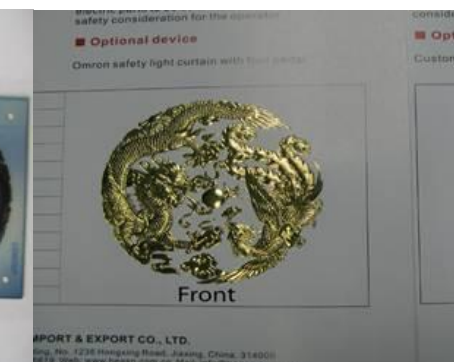
Final product with foil stamping & embossing