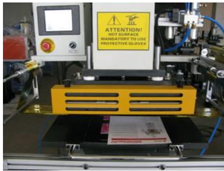
Worktable & heating plate with protective cover