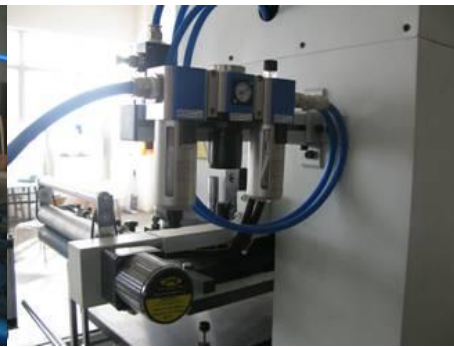
Airtac brand air components & foil running motor