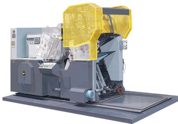
הזנה והעברה אוטומטית