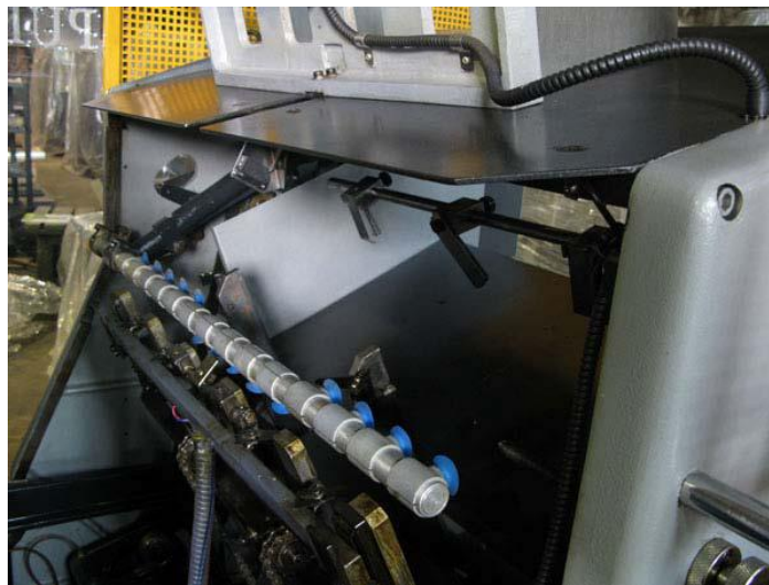
2 יחידות פויל