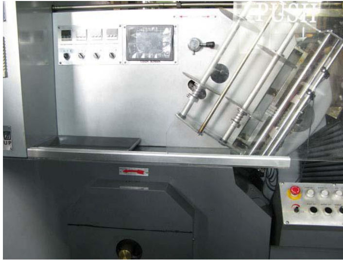
שולחן עבודה ופלטת כוורת